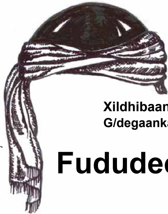
Xildhibaanka G/deganka oo ah